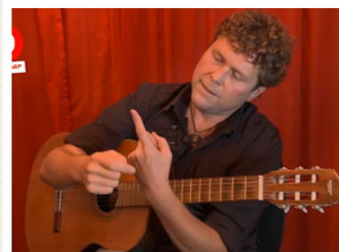
GEBRUIK JE ZIJKANT!