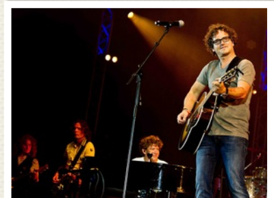
GUUS G-AKKOORD RULEZ!