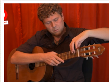
TEGEN DE FRETEN!