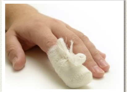
F AKKOORD MET BARRÉ!