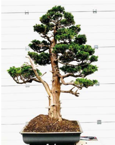
Chamaecyparis Obtusa (Cipres)