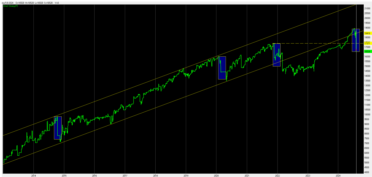
Afbeelding Rendementsgrafiek optieportefeuille

Dit is dan gelijk de reden dat WB voor de modelportefeuille voortaan ook uitgaat van maximaal 2 contracten.