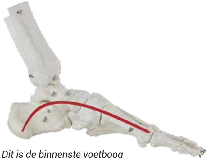
Dit is de binnenste voetboog

Rol het balletje 10 keer heen en weer, ga dan een stukje lopen en doe het hierna nog eens.