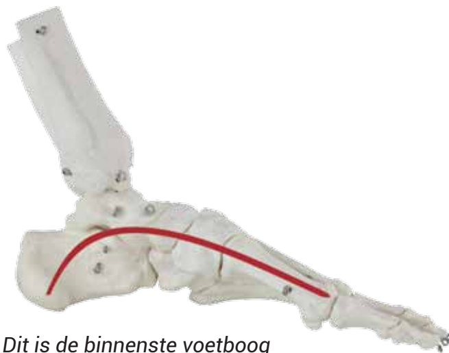
Dit is de binnenste voetboog

Rol het balletje 10 keer heen en weer, ga dan een stukje lopen en doe het hierna nog eens.