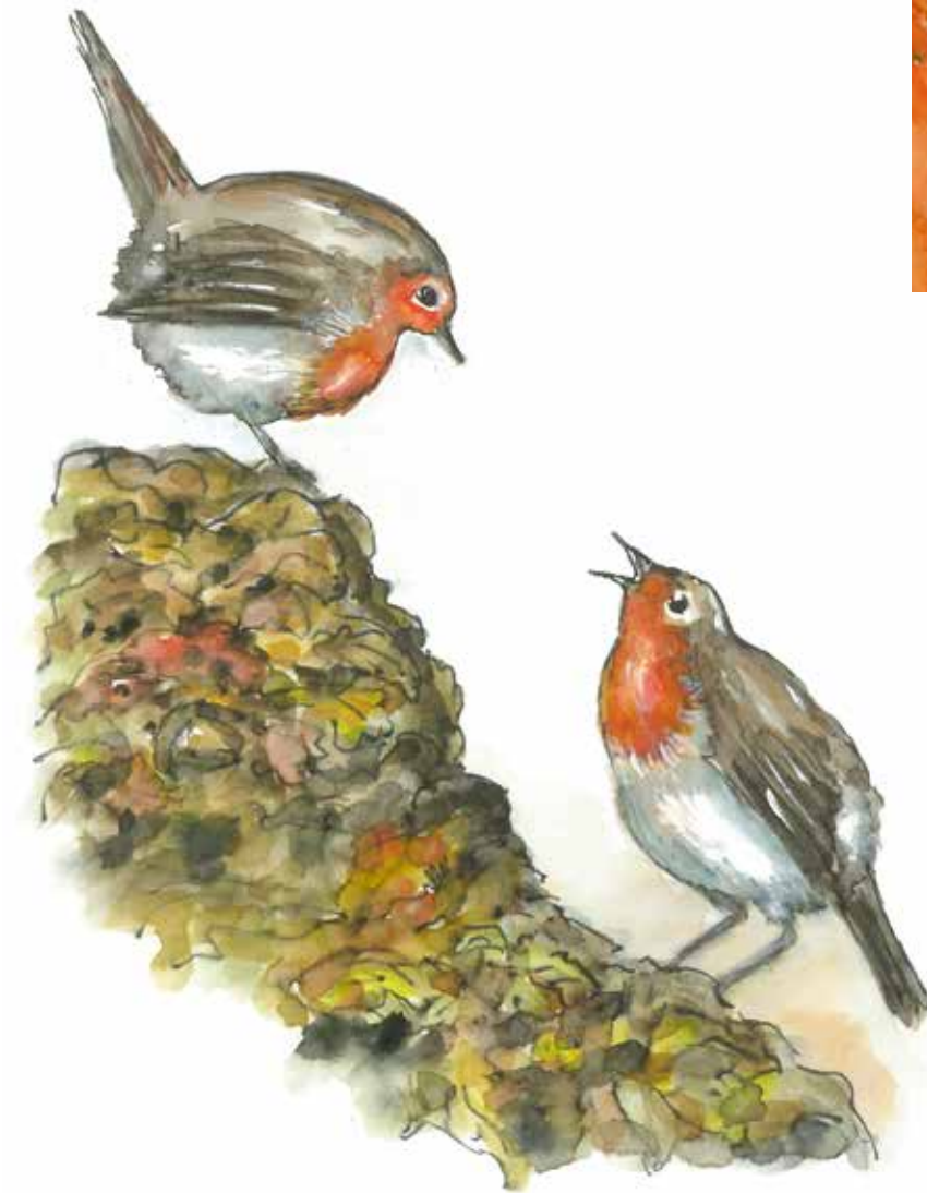
Illustraties: Anja Neubauer

Schrijven met je eigen stem is geen truc, het is een levenshouding. Het vraagt de moed om je eigen waarheid op papier te zetten. Je verstopt jezelf niet langer achter perfectionisme en veilige formuleringen, maar schrijft iets dat je lezer écht raakt. En dát is precies wat een tekst met jouw eigen schrijfstem onderscheidt van de rest. ■