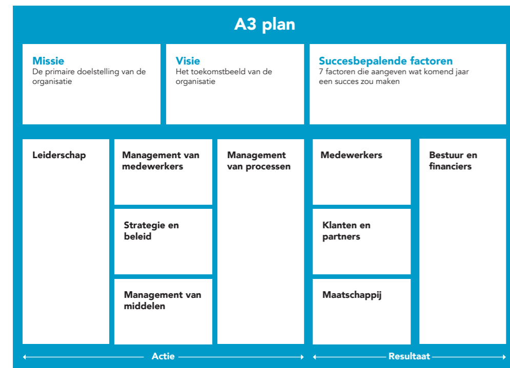
De verdeling van het A3 plan in Resultaat gebieden en Actie gebieden.

Nieuwsgierig naar de methodiek: lees meer op www.a3plan.nl .