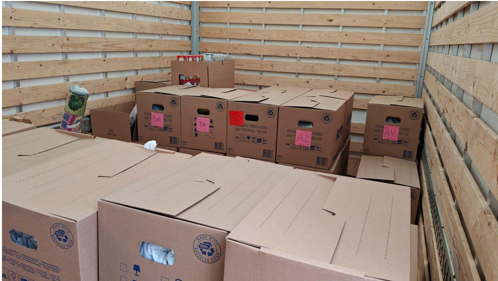
Op de voorbereidingsdag werden alle kado's per route met een verhuisbus van de inpaklocatie naar de actiedag locatie gebracht.

De dag voor de actiedag hadden we dit jaar een voorbereidingsdag. Op deze dag kwamen alle boodschappen binnen van Bidfood, Hema, Jumbo en AH. Ook hebben we zelf met een bus met laadklep alle kado's en extra's naar de locatie van de Voedselbank gebracht. Op de voorbereidingsdag is alles klaar gezet, waardoor op de actiedag zelf meteen gestart kon worden.