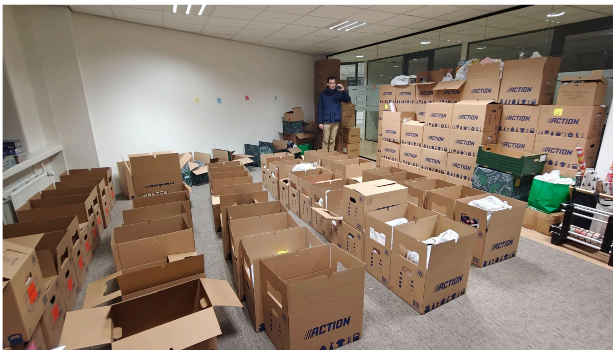
Bedrijfsruimte aangeboden door Merin in 2024, met cadeaus in dozen. Elke doos is 1 route.

Dit jaar heeft Smart Office van Merin een ruimte ter beschikking gesteld. Hier hebben we alle cadeaus ingepakt en op route gesorteerd. Elke doos is één route.