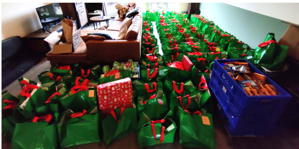
Een deel van de cadeautasjes uit 2023

In 2023 was de zolder van Maarten en Vanessa gebruikt als opslag en om alle voorbereidingen te treffen voor de actiedag. Dat was met het volume van 2023 al niet te doen. Maar in 2024 hebben we twee keer zoveel gezinnen geholpen. Daarvoor was het al snel duidelijk dat we een externe locatie nodig hadden.