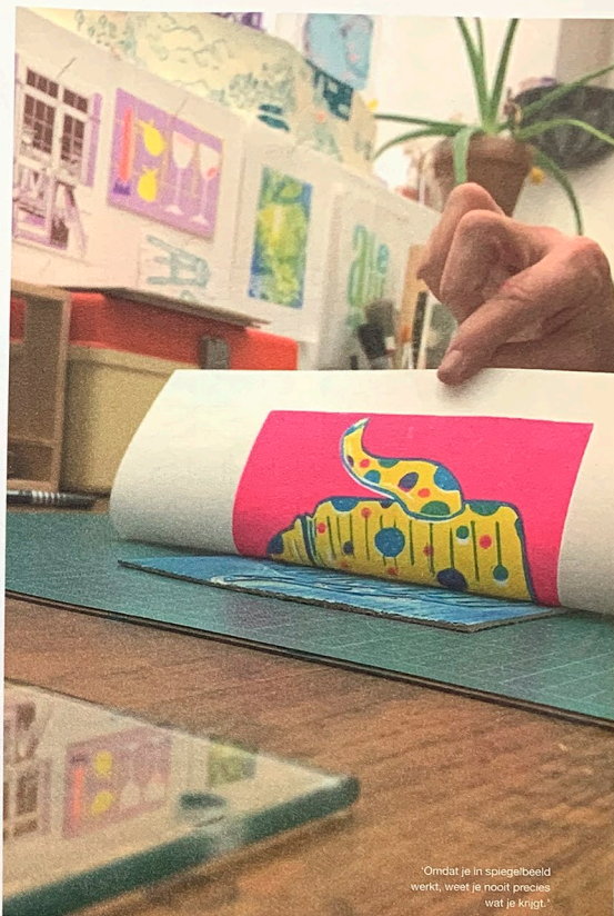
"Omdat je in spiegelbeeld werkt, weet je nooit precies wat je krijgt."

"Ik geniet er enorm van als mensen blijf worden van mijn lessen. Dat ze zichzelf verrassen met wat ze maken. Iets uit je handen laten ontstaan is iets unieks – ze zeggen wel dat je handen het meest verbonden zijn met je hart. Zelf merk ik ook dat ik me helemaal kan verliezen in een klus, veel meer dan bij digitaal werk. De tijd vliegt! Hoe leuk is het om mensen te inspireren om achter hun computer vandaan te komen?"