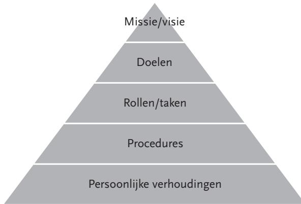
Figuur 2.1 Het teameffectiviteitsmodel van Fry (1978)

meer kans dat de teamleden emotioneel betrokken zijn en zich optimaal inzetten. Hoe meer overlap tussen de persoonlijke zingeving en hoe collectiever de ambitie, des te meer shared values , des te groter de motivatie, des te hoger het energieniveau, des te meer de neiging tot intern ondernemerschap, des te minder ineffectief gedrag en des te meer kans op magie in het teamwork (Weggeman, 2007). Het een leidt tot het ander, en bij teams begint dat met een heldere missie en visie.