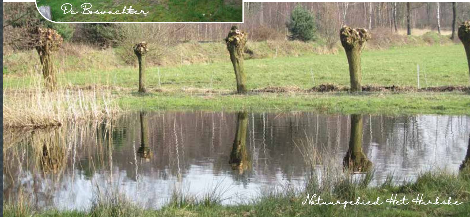
Natuurgebied Het Hurkske

Erp ligt op fietsafstand van Veghel. Hier worden grote evenementen zoals o.a. het festival Fabriek Magnifique en Veghel Nightlive georganiseerd. In het centrum aan het Heilig Hartplein ligt, aan de Zuid-Willemsvaart, een mooie binnenhaven wat voor een gemoedelijke sfeer zorgt. Via de A50 of met het openbaar vervoer zijn ook Eindhoven, Den Bosch en Nijmegen goed te bereiken.