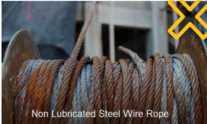
Non Lubricated Steel Wire Rope