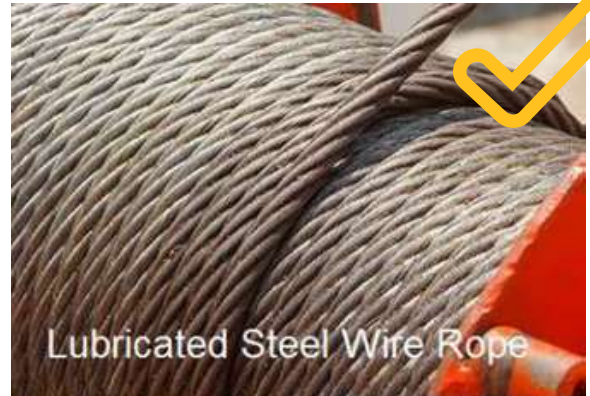
Lubricated Steel Wire Rope