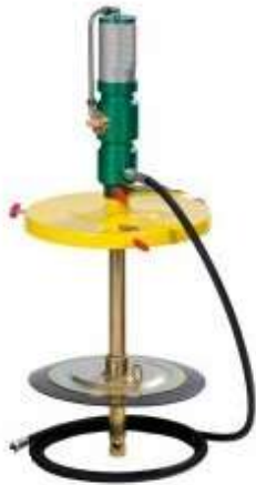
LT-WRLPMP020 LT-WRLPMP050 LT-WRLPMP180