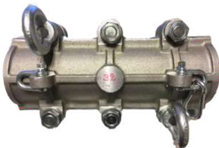
Lubretec Wire Rope Lubricator, Extra Seal Kit IZ-WRLDS01A0+ mm