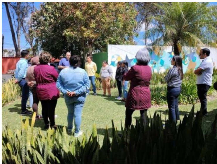
Foto: Training in Guatemala