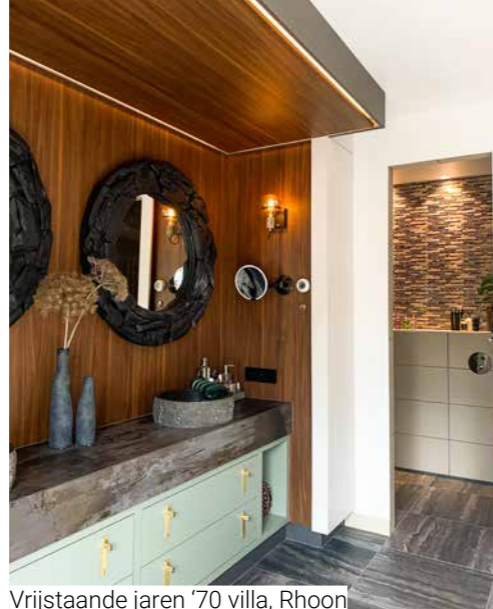
Vrijstaande jaren '70 villa, Rhooon