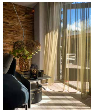
Vrijstaande jaren '70 villa, Rhooon