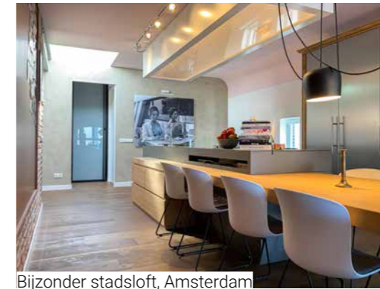
Bijzonder stadsloft, Amsterdam