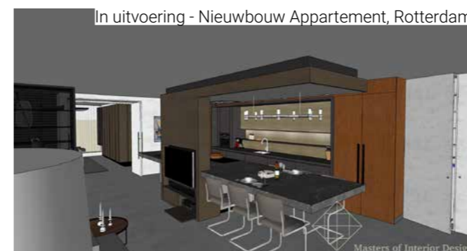
In uitvoering - Nieuwbouw Appartement, Rotterdam

Sven: “Dat klopt. Maar ik merk wel dat we nu steeds meer de ‘pareltjes’ eruit pakken. De écht leuke projecten. We hebben door Institute of Interior Impact ook een keuze gemaakt om een beperkt aantal ontwerpprojecten per jaar te doen.”