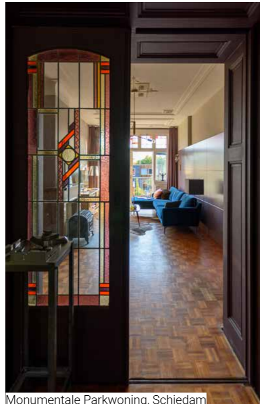
Monumentale Parkwoning, Schiedam

van de bewoner. Hoe zou hij of zij met het gezin leven? Welke keuzes zouden ze maken. Dat is best intens. Maar blijkbaar iets dat wij erg goed kunnen.”