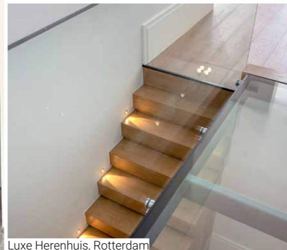
Luxe Herenhuis, Rotterdam