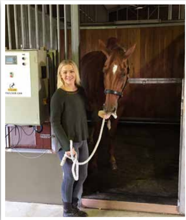
Het stalmodel van de Vitafloor.

Je kunt hem daarna zo weer oppakken, want qua bespierung zet een paard in zo'n rustperiode geen stap achteruit", zegt Jurgen enthousiast. "Ik merk dat de Vitafloor echt een positieve bijdrage aan de training geeft. Als je met topsport bezig bent is ieder stukje extra dat je een paard kan geven mooi meegenomen."