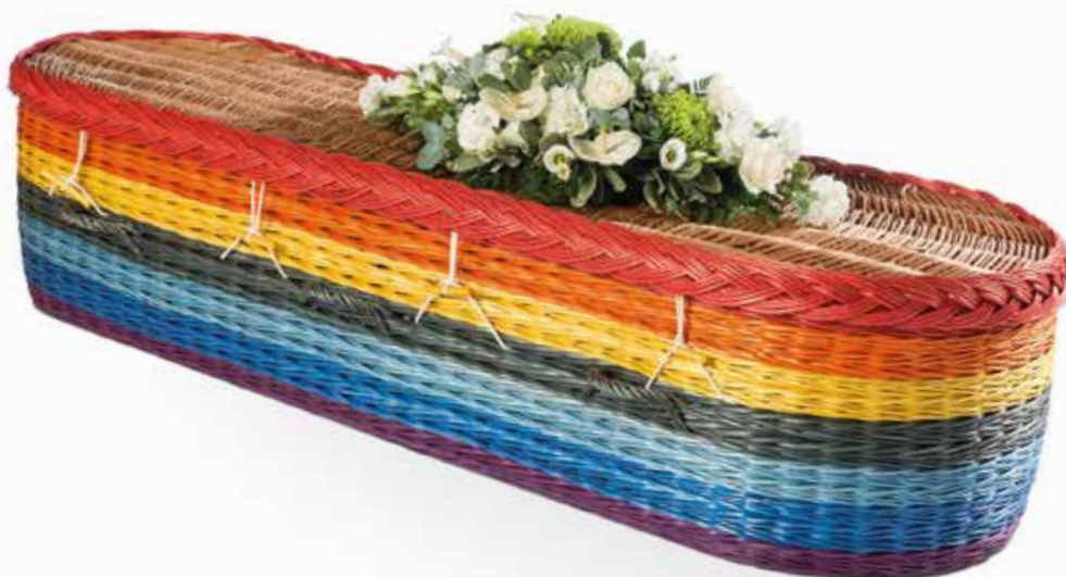
De "Regenboog" uitvaartmand