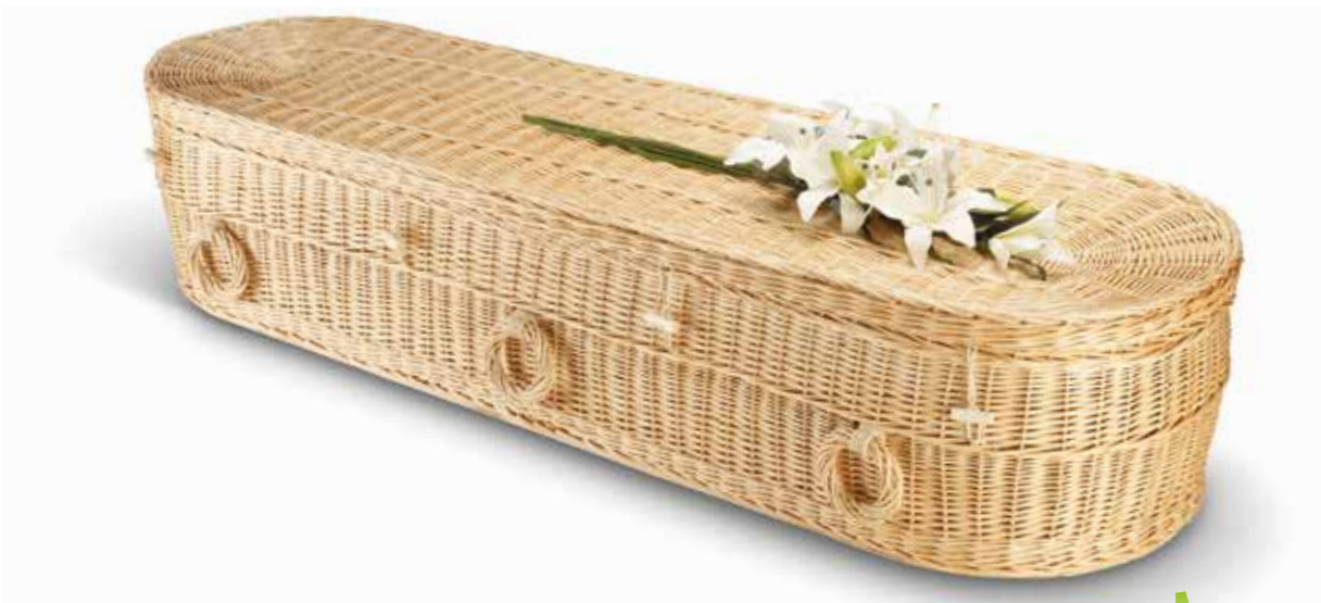
Wilgenteen Cromer Rond Naturel