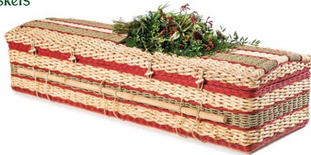
Bananenblad Casket Cerise