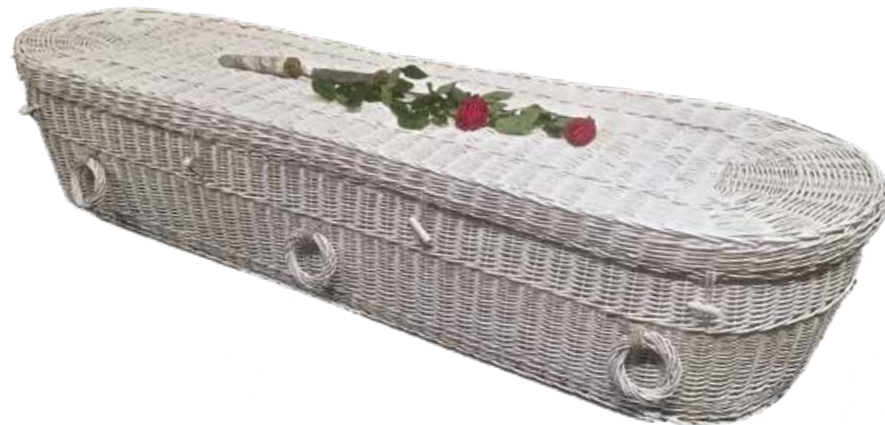
Wilgenteen Cromer Rond Wit

De laatste jaren zien we een toenemende vraag naar witte uitvaartmanden. De Wilgenteen Cromer Rond Wit is een welkome aanvulling in ons assortiment gebleken. Het is een vriendelijk ogende witte mand met frisse en moderne uitstraling.