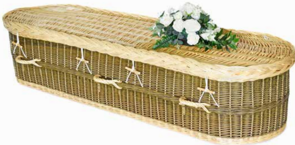
Engels Wilgenteen Rond Wit-Groen