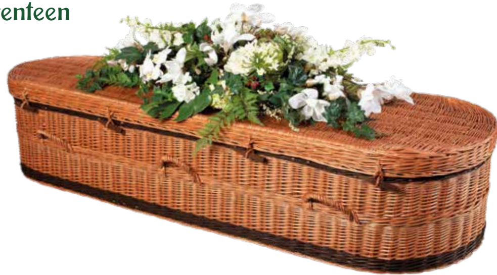
Wilgenteen Elne Rond

De laatste jaren zien we een toenemende vraag naar witte uitvaartmanden. De Wilgenteen Cromer Rond Wit is een welkome aanvulling in ons assortiment gebleken. Het is een vriendelijk ogende witte mand met frisse en moderne uitstraling.