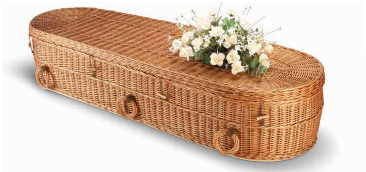
Wilgenteen Cromer Rond