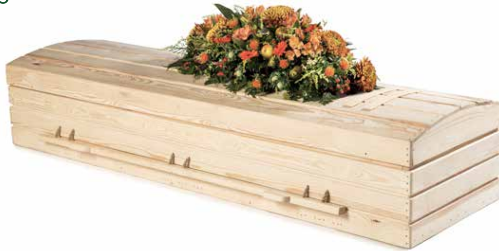
Pine Eco Casket