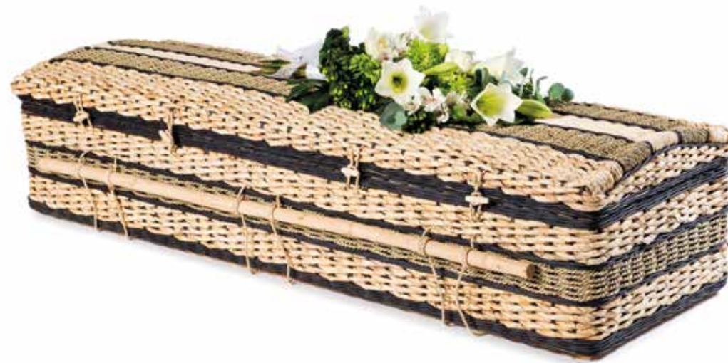
Bananenblad Casket Ebony