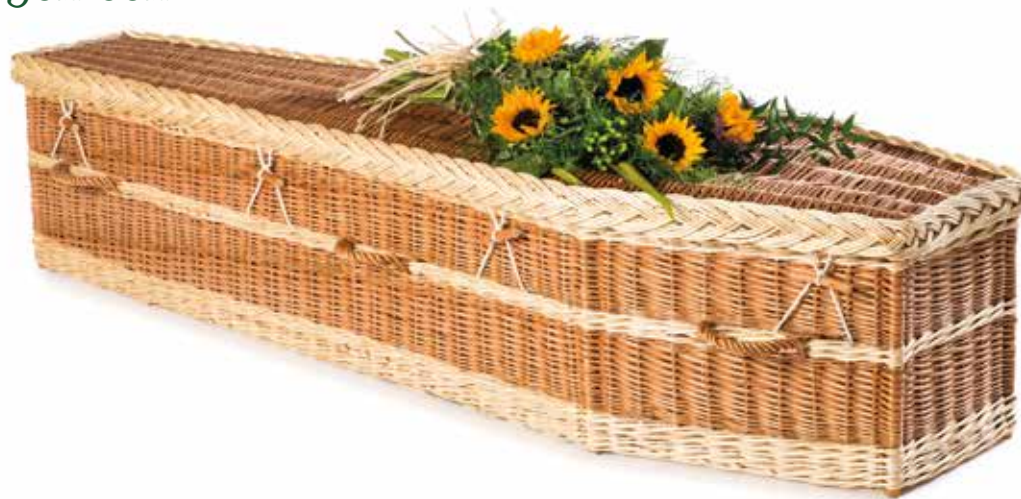
Engels Wilgenteen Traditioneel Wit

Interieur van ongebleekt katoen GreenCoffins worden geleverd inclusief een interieur van ongebleekt katoen, een wade van watervast ongebleekt katoen en een biologisch afbreekbaar hoofdkussen of een bamboe eco hoofdsteen.