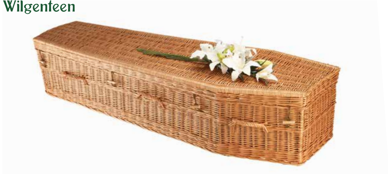
Wilgenteen Highsted Traditioneel