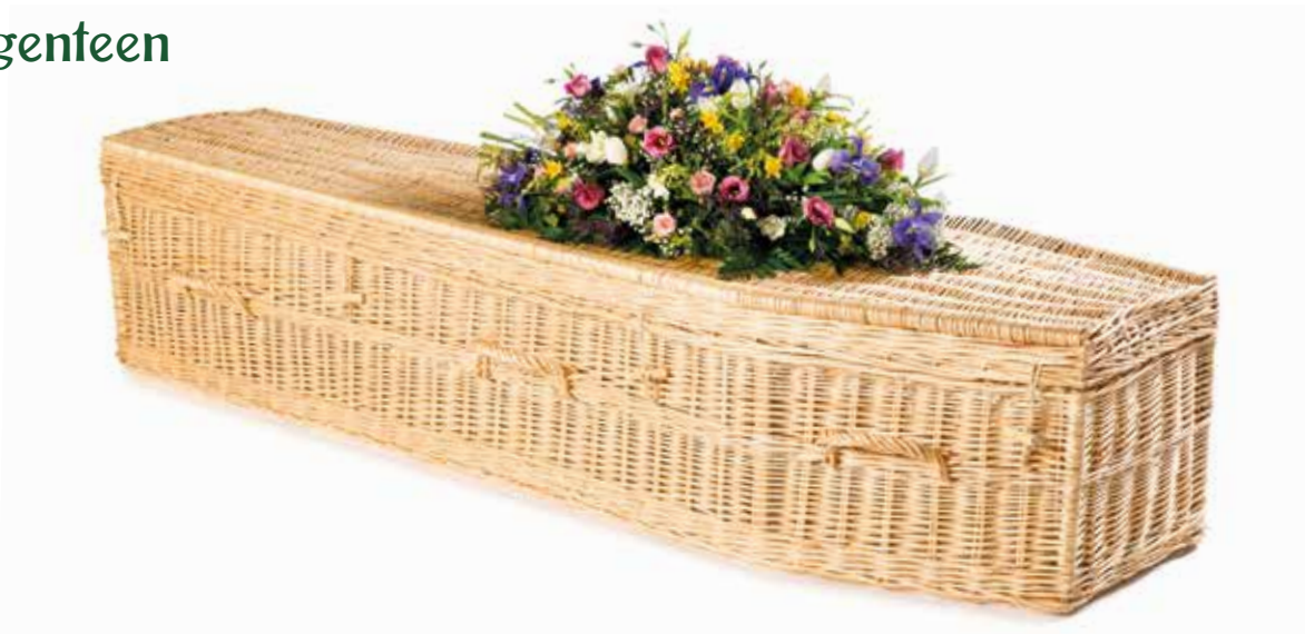
Wilgenteen Highsted Traditioneel Naturel