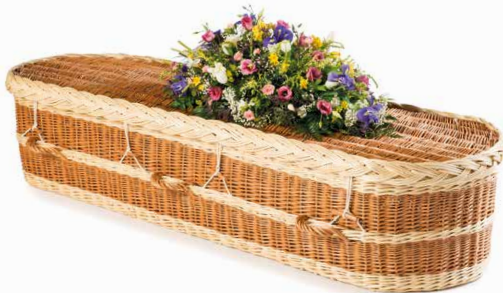
Engels Wilgenteen Rond Wit