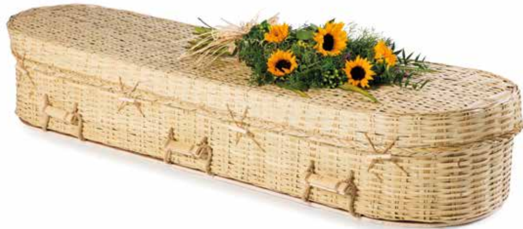
Bamboe Eco Rond