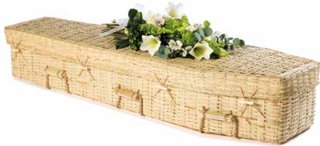
Bamboe Eco Traditioneel