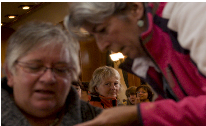
Hier is de autofocus ingesteld op de achtergrond.