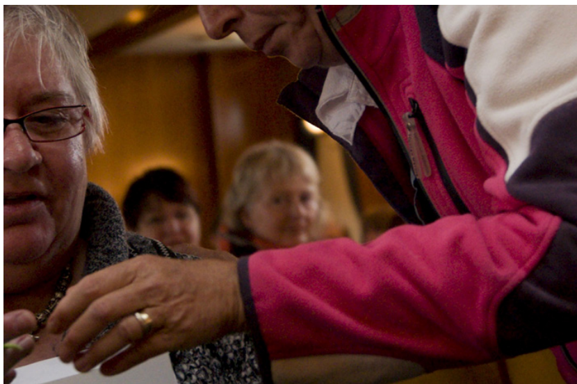
Hier zie je de standaard autofocus, ingesteld op de voorgrond.