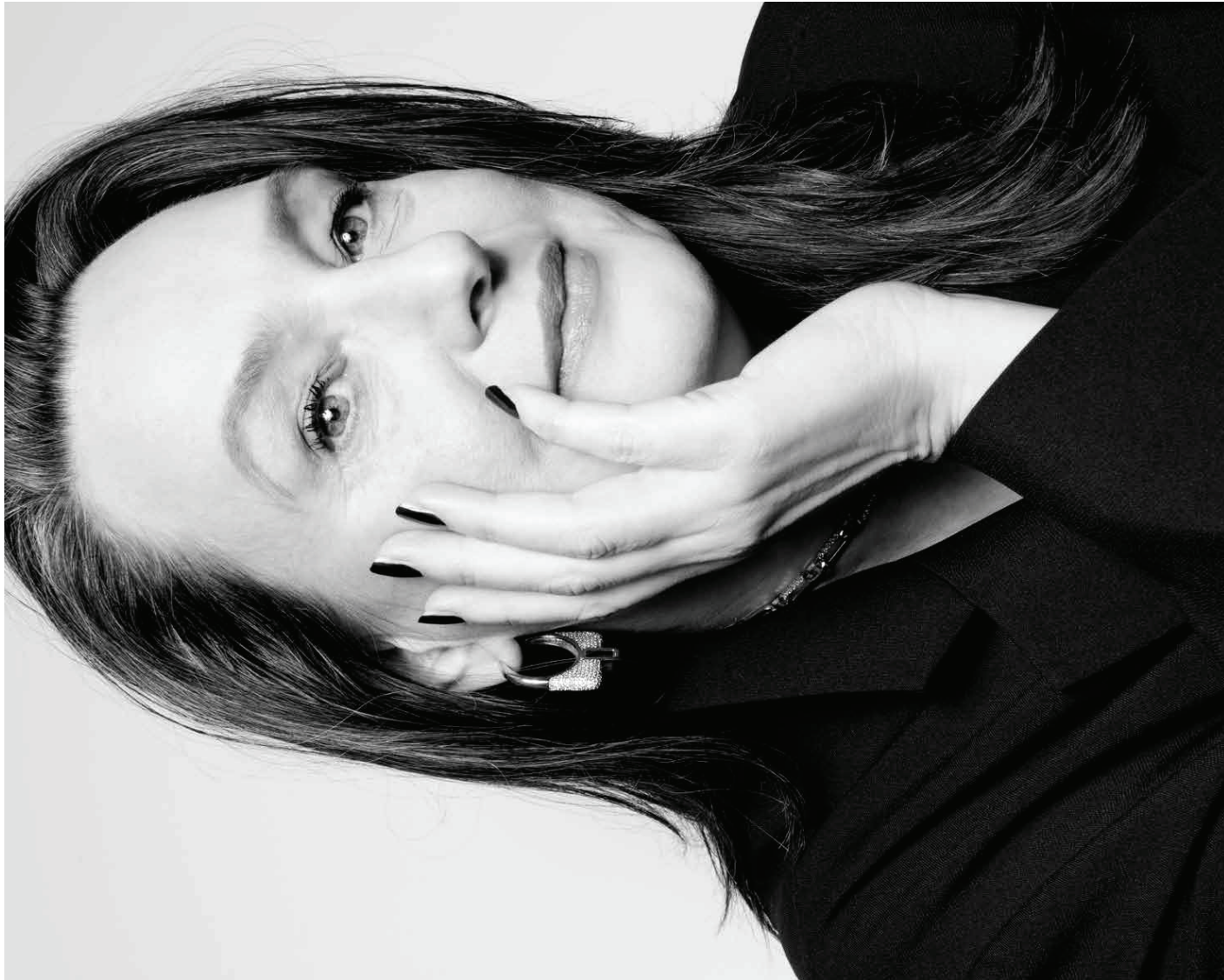
HAAR & MAKE-UP LAURA DE WARD STYLING GRAZIELLA FERRARO BLAZER FRANKIE SHOP VIA DE BIJENKORF OORBELLEN EN CHOKER JULI DANS JEWELS