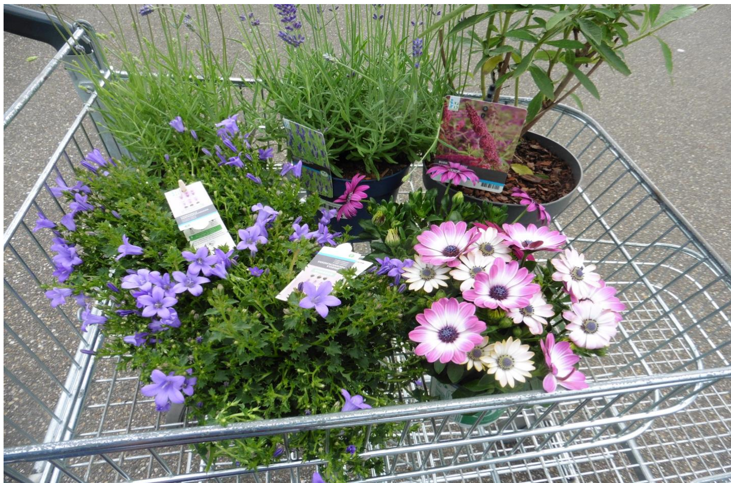
Tuinplanten uit een tuincentrum voor onderzoek naar de aanwezigheid van bestrijdingsmiddelen