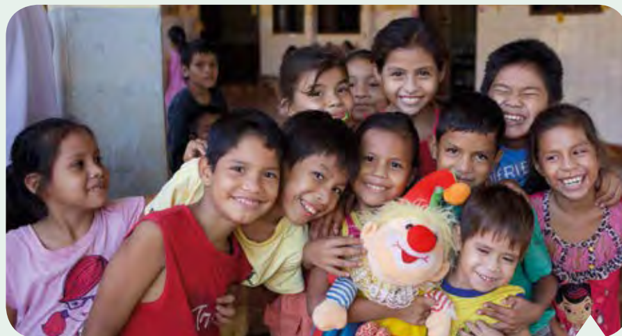
Een veilige plek voor kinderen die anders op straat zwerven.

en basisonderwijs. Ze leren zich te wassen en hun tanden te poetsen, en hoe ze met elkaar om kunnen gaan. Ze worden sterk, gezond en weerbaar. Er is ook aandacht voor hun thuissituatie en waar mogelijk ondersteunt het centrum de gezinnen. Een belangrijk doel van Curucusí is namelijk om de omstandigheden van de kinderen binnen hun eigen families te versterken. Bovendien begeleidt het centrum de kinderen naar het reguliere onderwijs.