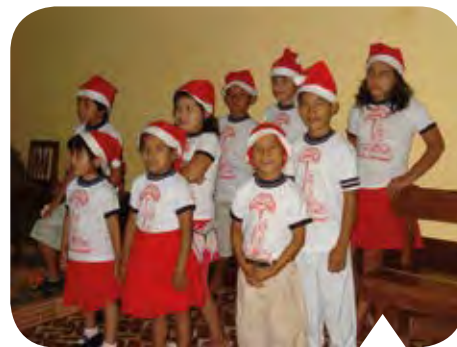
Blijde gezichten op het Kinderkerstfeest.

Dankzij de steun van onze donateurs, vrienden zoals u, hebben we in Riberalta opnieuw het grote Kinderkerstfeest kunnen vieren met de vele kinderen die als straatverkopertjes moeten werken om bij te dragen aan het gezinsinkomen. En feest was het! Wat een hoop blijde gezichten hebben we gezien! Ondanks de feestelijkheden – Kerstmis wordt uitbundig gevierd – heerst er spanning onder de bevolking in ons werkgebied, want het regenseizoen is weer begonnen. Zullen dorpen en akkers ondanks de watermassa's