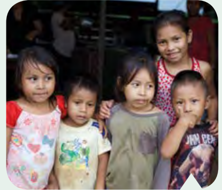
Bouw alstublieft mee aan de toekomst van deze kinderen!

Wat is het dan mooi om te merken dat ze, met de liefdevolle aandacht van onze medewerkers, uit hun schulp kruipen en zichtbaar opknappen. De jongens en meisjes krijgen schone kleren en schoenen, dagelijks een voedzame maaltijd