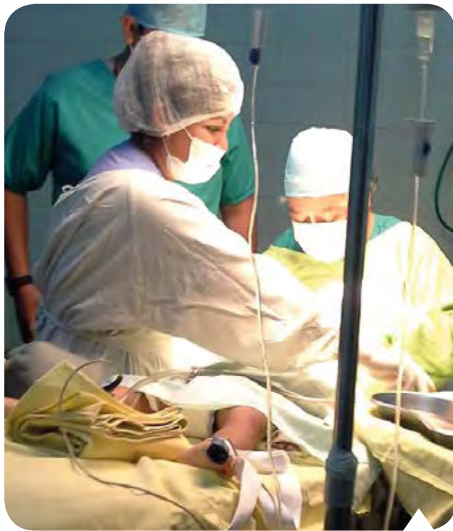
Hersteloperaties goed verlopen. De dankbaarheid is groot!