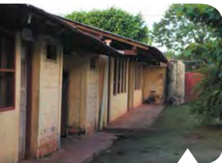
Het gebouwencomplex staat er treurig bij. De renovatie is hard nodig!

mogen ontvangen. Dat is natuurlijk een schitterend bedrag en we zijn iedereen die heeft bijgedragen enorm dankbaar. Toch is het onvoldoende om met de renovatiewerkzaamheden te kunnen starten. Want, wat doe je wel en wat doe je niet? Met de bouwmeester wordt opnieuw naar de