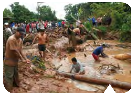
Een foto uit 2014.

die door vallende noten zijn geraakt. Sommige mensen worden door giftige slangen of spinnen gebeten. Uw hulp en bijstand blijven nodig om de arme bevolking bij te staan. Dank, dat wij steeds op uw trouwe steun mogen blijven rekenen! ●