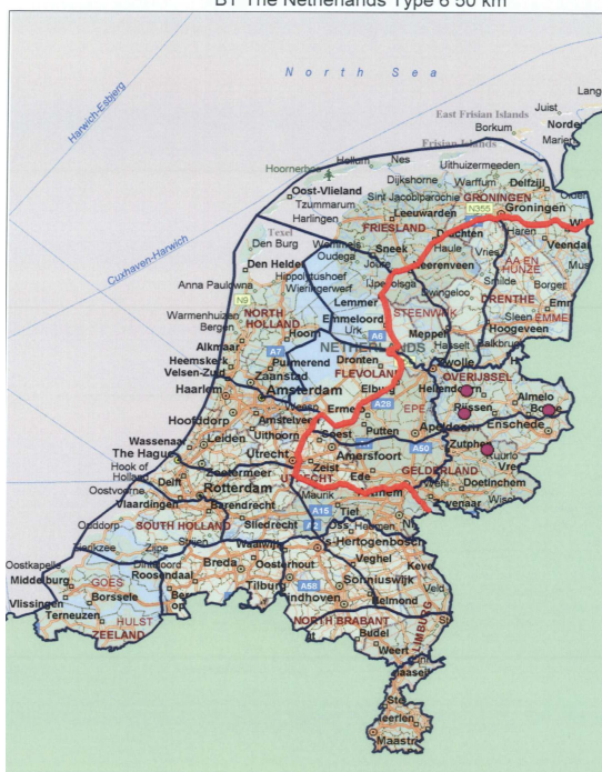
BT The Netherlands Type 6 50 km

Bezoek onze website, klik in het menu op "Downloads" en dan op "Export"