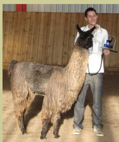
Best of Show Lama

Zoals te zien is wordt er veel aandacht besteed aan het samenspel tussen mens en dier. Het vertrouwen dat een dier in de mens heeft is hierbij heel belangrijk. Het onderdeel sport wordt in de Benelux nog niet door zoveel alpacahouders beoefend. Het is te vergelijken met de behendigheidssport voor honden. Samen met je lama of alpaca leg je een hindernisparcours af. Het gaat dan niet om de snelste tijd maar om de minste fouten.