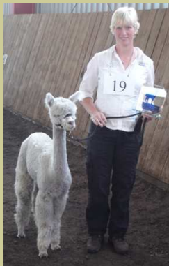
Best of Show Alpaca

“veel aandacht aan het samen- spel tussen mens en dier.”